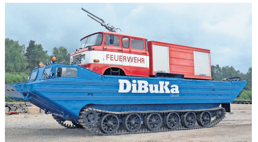
Schwimmpanzer machen es möglich, dass auch W-50-Löschfahrzeuge übers Wasser fahren können.

In diesem Fall begleitet eine Drohne das Geschehen aus der Luft. „Sie kann per Infrarotkamera auch versteckte Glutnester aufspüren“, erklärt Goldammer. Die Daten werden live an die Einsatzleitung übermittelt und diese kann entsprechend reagieren. Die Drohne durfte laut Goldammer aus den USA eingeführt werden. Ein Gast ist aus Los Angeles, in dessen Umgebung immer wieder Feuersbrünste wüten.