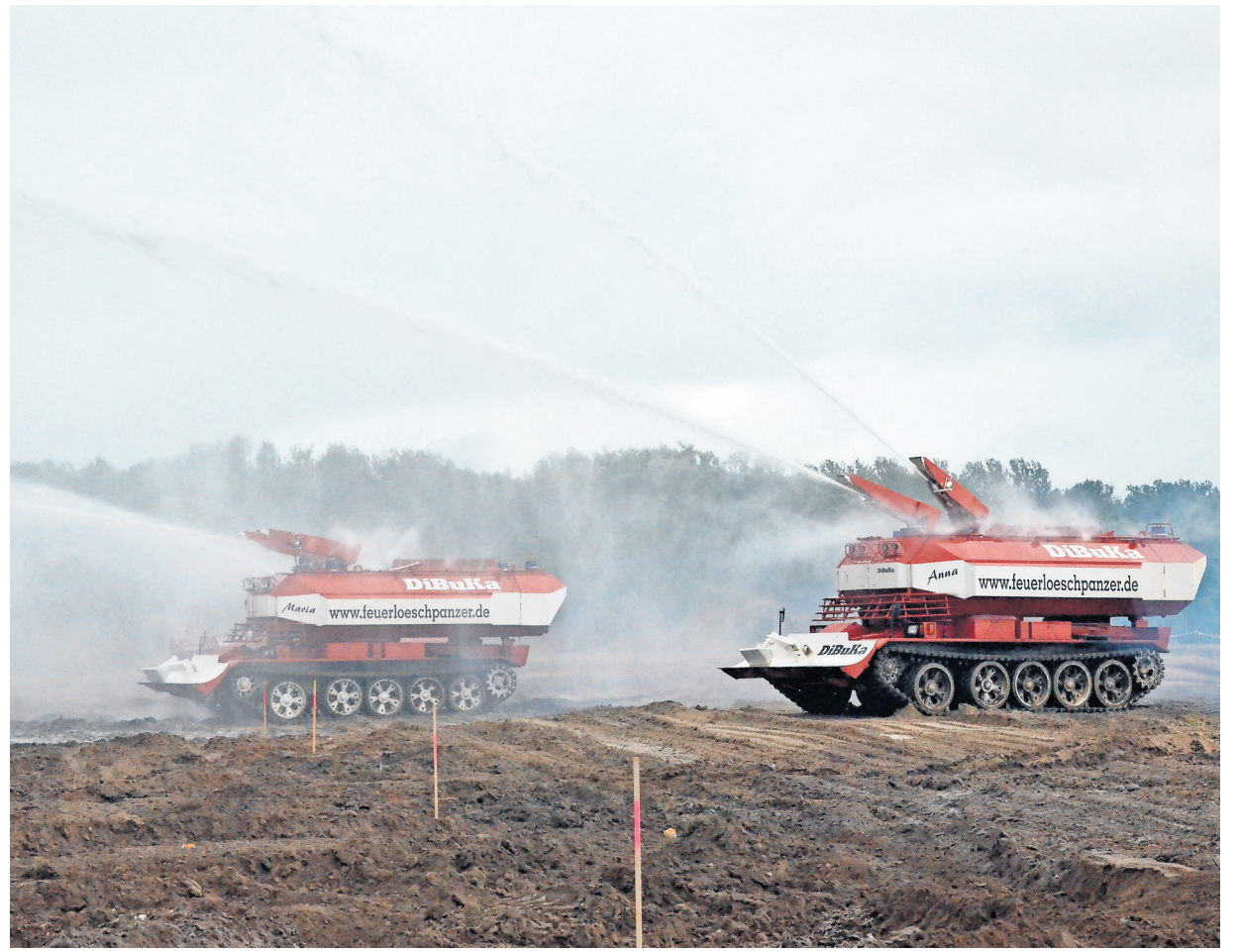
Feuerlöschpanzer der Firma Dibuka können dank Hochdruckanlage bis zu 65 Meter weite Wasserfontänen aussenden. Auf dem Übungsgelände bei Nitzow zeigten sie sich in Aktion.