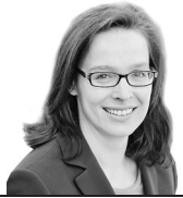
Von Kathrin Gottwald