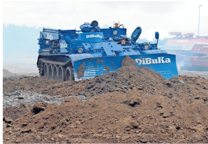
Nach der Munitionsberäumung schiebt der Panzer eine Brand-schneise ins Gelände.

D er Enkeltrick grassiert wieder. Ältere Leute werden von Unbekannten angegriffen: „Rate mal, wer hier ist?“. Der vorgebliche Enkel ist immer in finanziellen Schwierigkeiten, kann ein einmaliges Immobilien-Schnäppchen machen oder muss nach einem Unfall eine teure Autoreparatur bezahlen. Die liebe Oma kann doch sicher kurzzeitig mit Geld aushelfen? Der Enkel ist auch immer in Zeitnot und muss einen „ganz lieben Bekannten“ schicken, das Geld abzuholen. Leider funktioniert diese üble Masche noch zu oft, und die Opfer werden um ihr Ersparnis gebracht. Was man wissen sollte, ehe man ein Urteil über die vermeintlich leichtgläubigen Alten fällt: Die Trickbetrüger sind keine Einzeltäter, sie arbeiten in großen Gruppen mit mafia-artigen Strukturen und hochprofessionell. Sie grasen bundesweit ganze Telefonbücher nach alt klingenden Vornamen ab. Und Hirnforscher haben herausgefunden, dass im Alter der Teil des Gehirns, der für Misstrauen zuständig ist, schwächer wird. Einen 100-prozentigen Schutz gegen den Enkeltrick gibt es leider nicht. Es hilft nur, mehr aufeinander zu achten. Auf die eigene Oma und auf die in der Nachbarschaft.